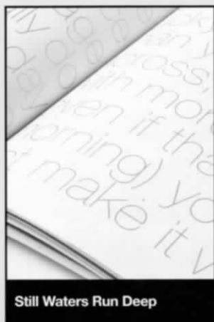
Still Waters Run Deep