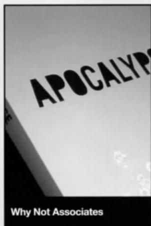
Why Not Associates