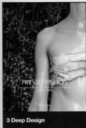
3 Deep Design